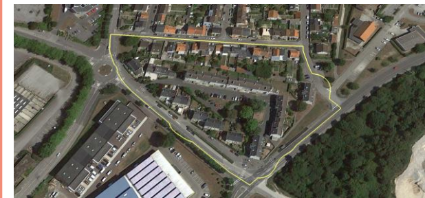
Cherbourg (50) Docteur Deslandes